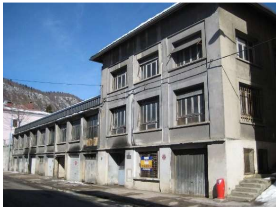
Lapidairerie Buffard 37 rue de la République