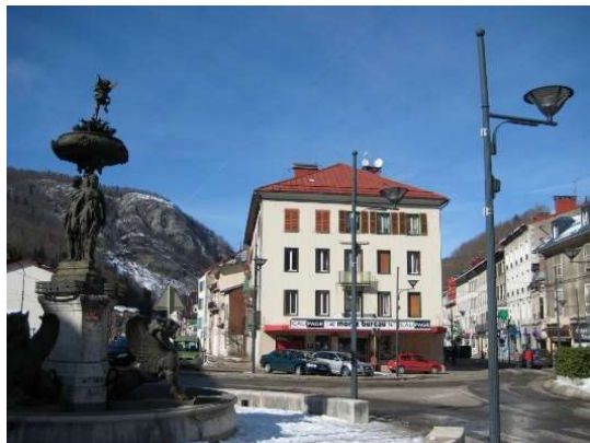
Place Henri Lissac vue sur Fontaine