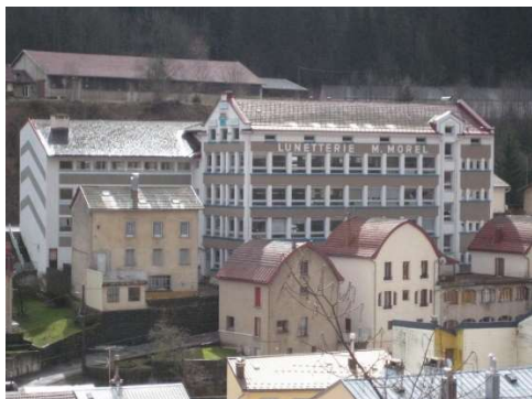
Vue de la carrière Di Lena