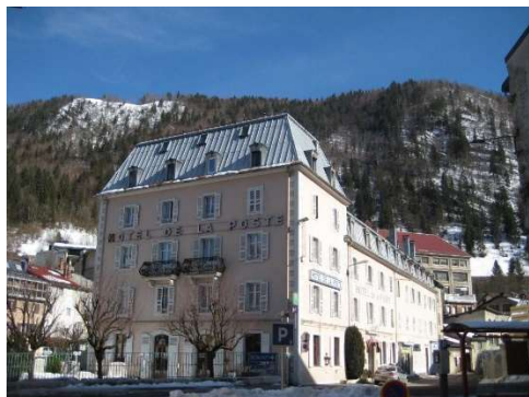
Hôtel de la Poste 165 rue de la République