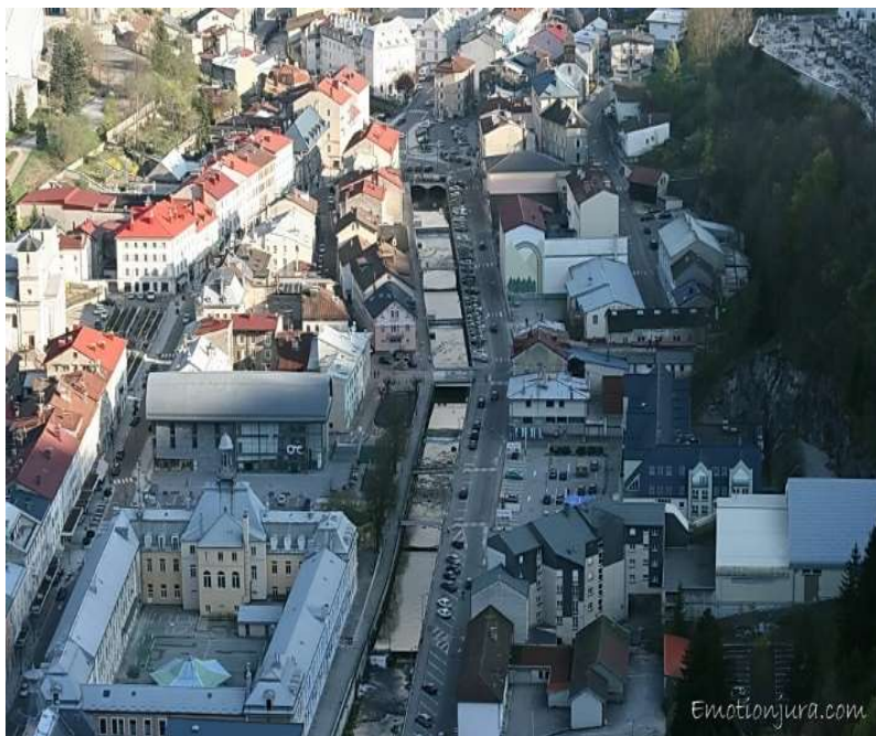
Morez vue d'avion