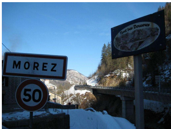
Rocade vue du Pont des Douanes