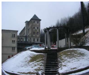
Pergola de l'ex-ENP rue Victor Bérard