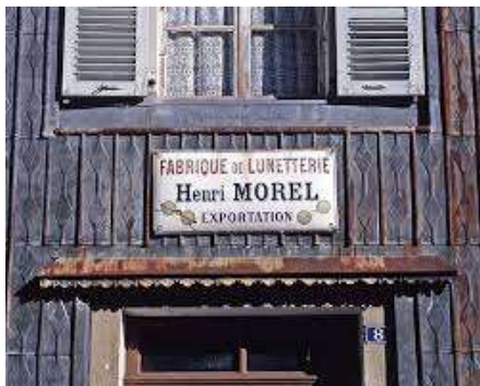
Ets Henri Morel 8 rue de la Tannerie