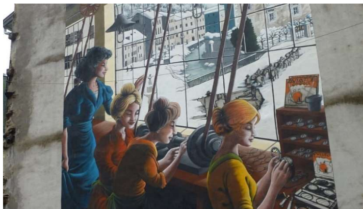
Sylvano Arts graphiques