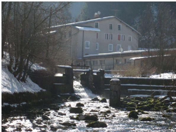
Ecluse Cochet en haut de Morez